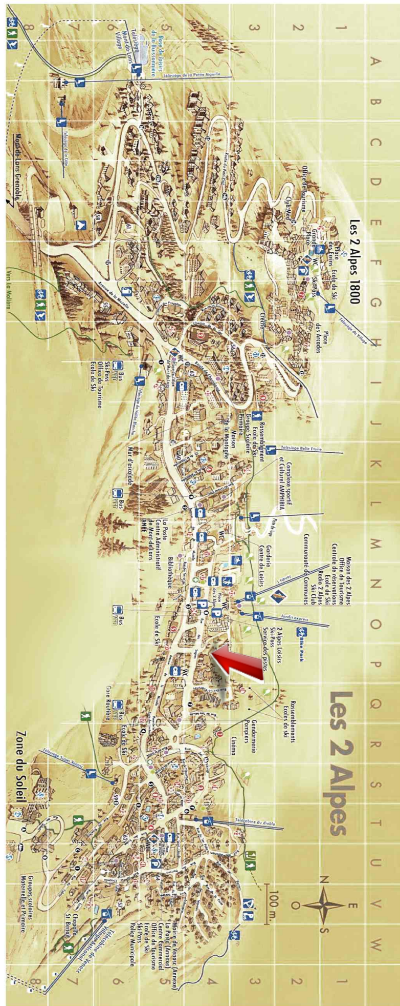
Studio - T1 - Les deux alpes (réf. loc-cb2f3)