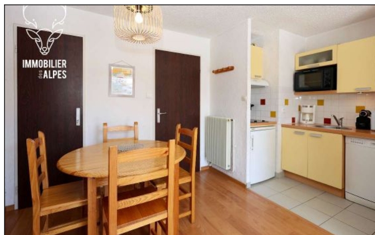
Studio - T1 - Les deux alpes (réf. loc-cb2f3)