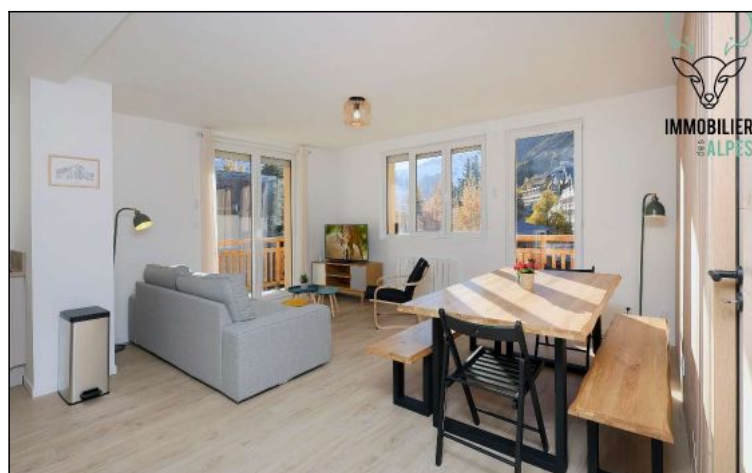
Appartement - T4 - Les deux alpes (réf. LOC-VIO12)