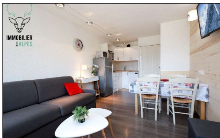
Studio - T1 - Les deux alpes (réf. loc-ps1508)