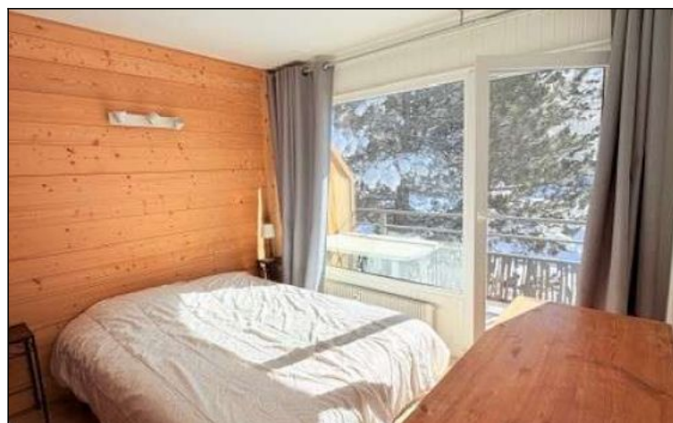
Appartement - T2 - Les deux alpes (réf. ven-olysul)