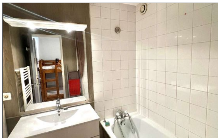
Studio - T1 - Les deux alpes (réf. ven-chamar)