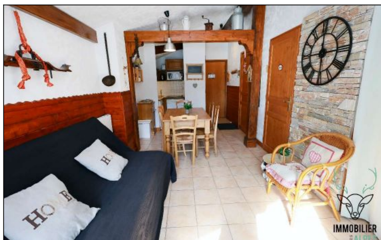
Appartement - T2 - Les deux alpes (réf. VEN-CHADEL)