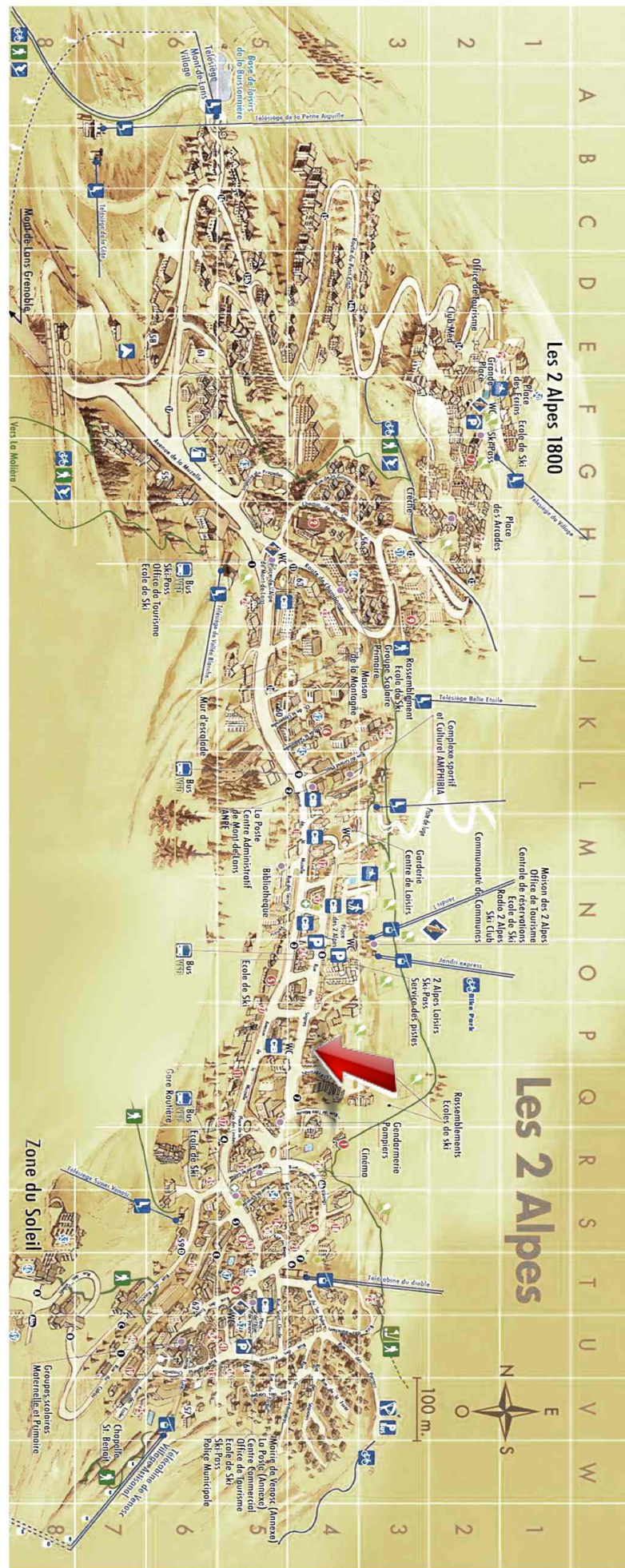
Studio - T1bis - Les deux alpes (réf. LOC-TYR68)