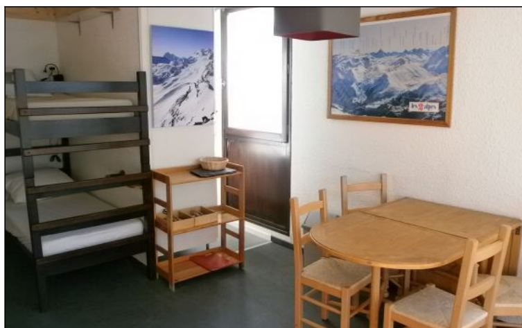
Studio - T1 - Les deux alpes (réf. LOC-330078)