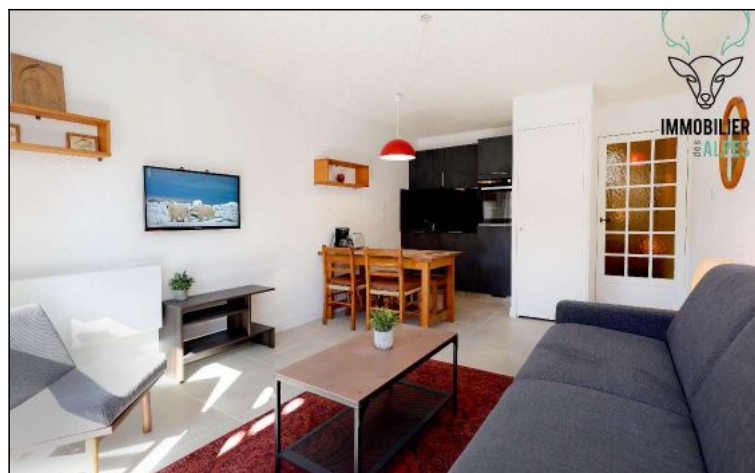
Studio - T1bis - Les deux alpes (réf. LOC-TYR11)