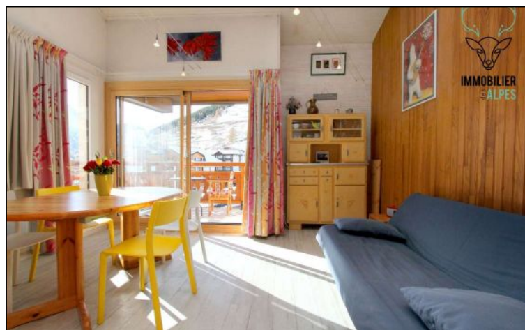
Appartement - T4 - Les deux alpes (réf. loc-ALB401A)