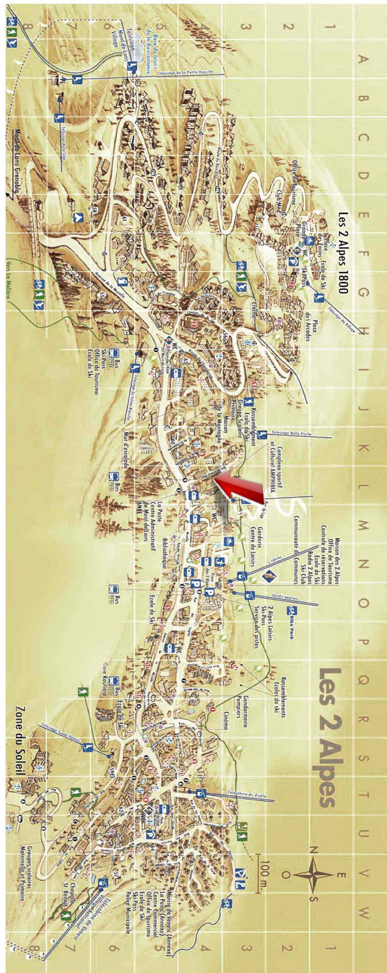
Appartement - T4 - Les deux alpes (réf. loc-ALB401A)