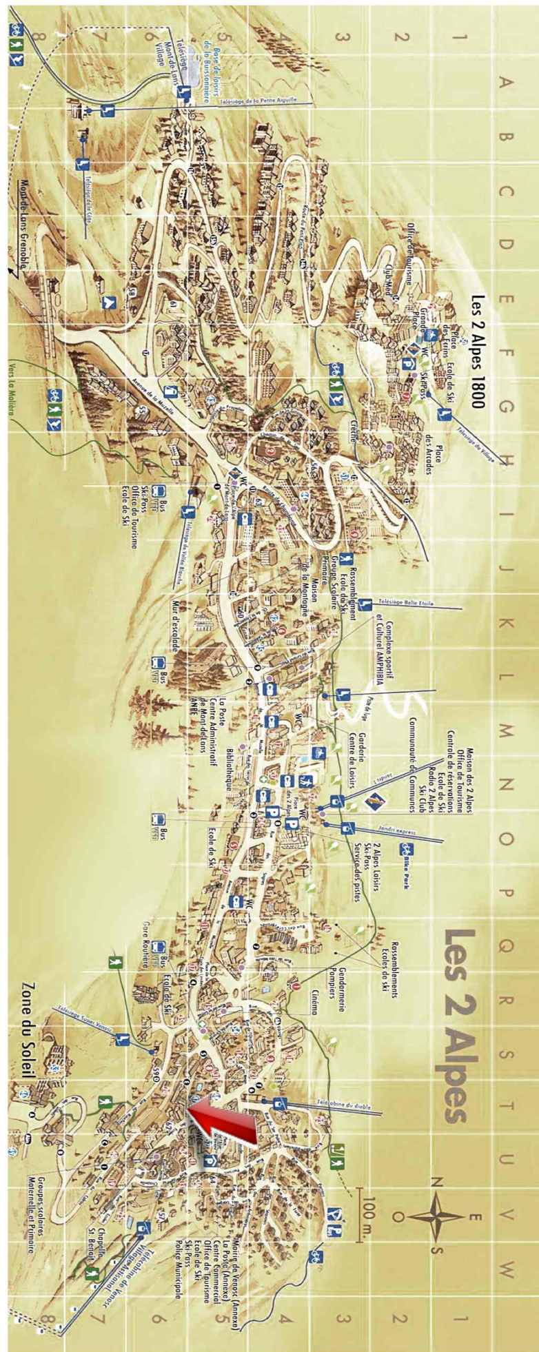
Studio - T1bis - Les deux alpes (réf. loc-sud25)