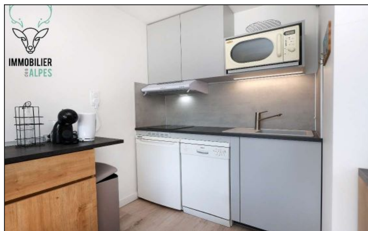
Studio - T1bis - Les deux alpes (réf. loc-sud25)