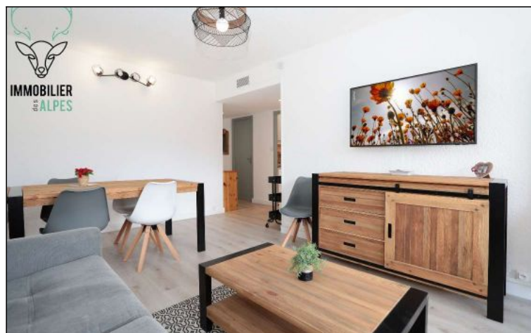
Appartement - T4 - Les deux alpes (réf. loc-cab31)