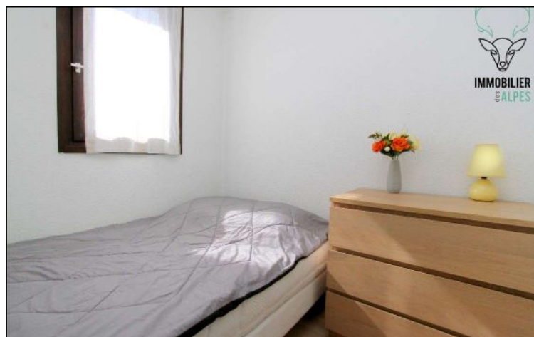
Appartement - T2 - Les deux alpes (réf. ven-andro3)