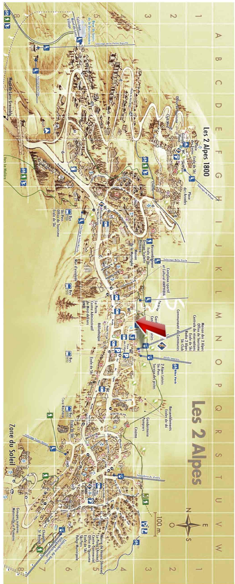
Studio - T1bis - Les deux alpes (réf. loc-vbd1)