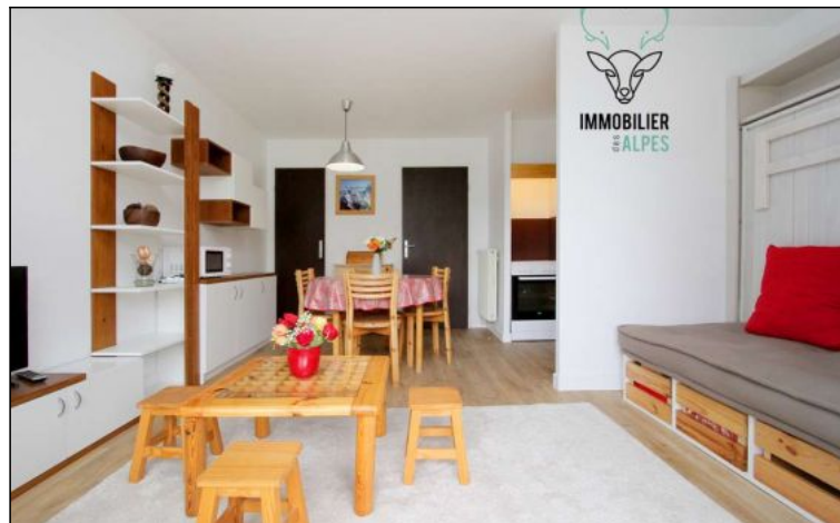
Studio - T1 - Les deux alpes (réf. loc-CB3F2)