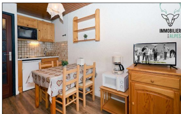
Studio - T1 - Les deux alpes (réf. LOC-ALB202B)