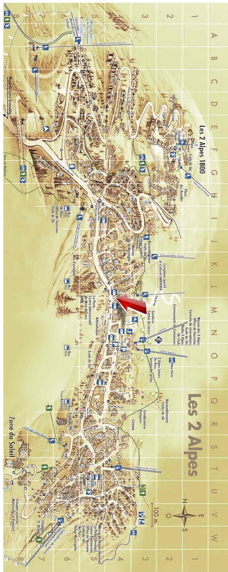
Studio - T1 - Les deux alpes (réf. LOC-ALB202B)